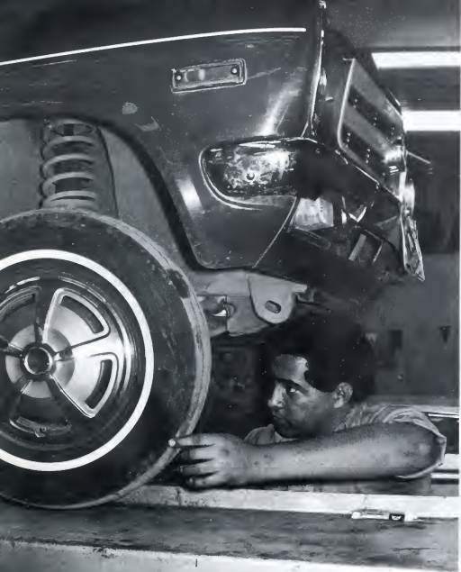
De ontwikkeling van de maatschappij is in de eerste plaats de ontwikkelingsgeschiedenis van de productie.